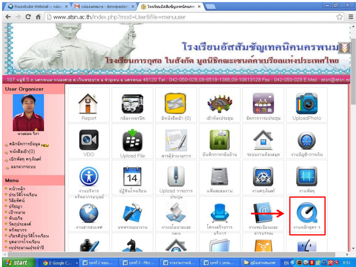
รูปที่ 44 หน้าจัดการ

4. หลังจากทีคลิกเมนูงานหลักสูตรแล้ว จะปรากฏเมนูที่ใช้ในการจัดการดังภาพ ให้คลิกเพิ่มข้อมูลวิชา จากนั้นให้เลือกสาขาวิชา และปีนักเรียนหรือรุ่น ข้อมูลส่วนนี้จะเชื่อมกับข้อมูลงานทะเบียนและสารบรรณ ถ้ายังไม่เพิ่มข้อมูลปีจะยังไม่ขึ้น